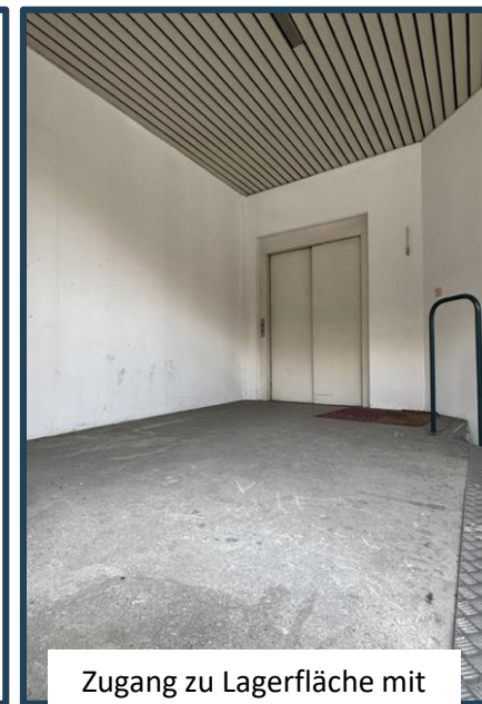
Zugang zu Lagerfläche mit Lastenfahrstuhl.