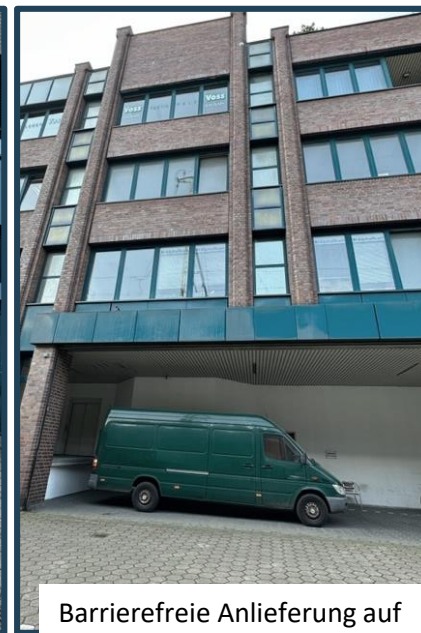
Barrierefreie Anlieferung auf der Rückseite des Gebäudes.