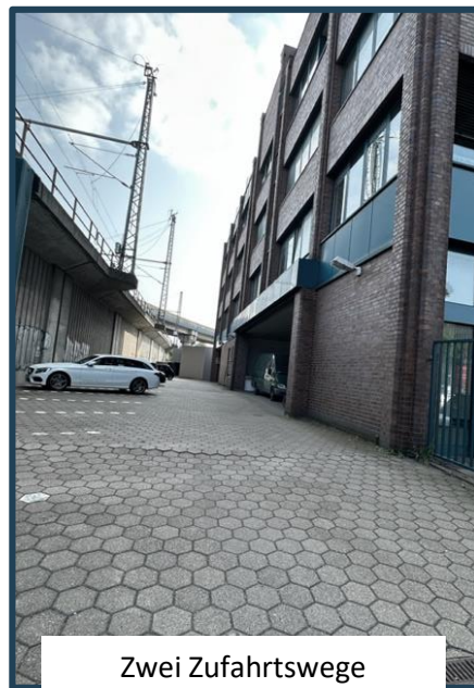
Zwei Zufahrtswege zum Hof-Parkplatz