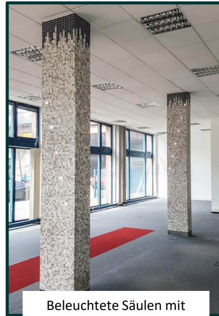
Beleuchtete Säulen mit Mosaik-Steinen