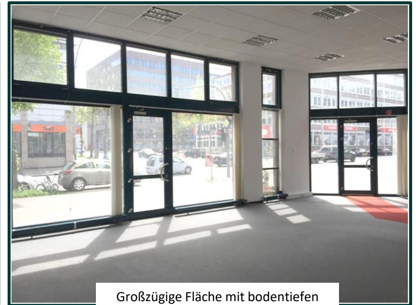
Großzügige Fläche mit bodentiefen Fenstern; Zwei Eingänge.